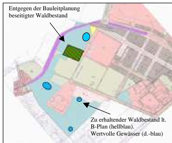
Bebauungsplan Nordpark (Stand: 1997)