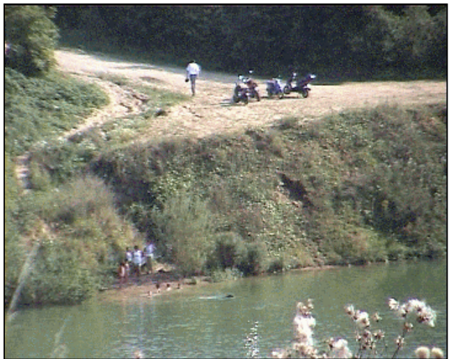
Der Hauptzugang – hier ist noch einiges zu tun!