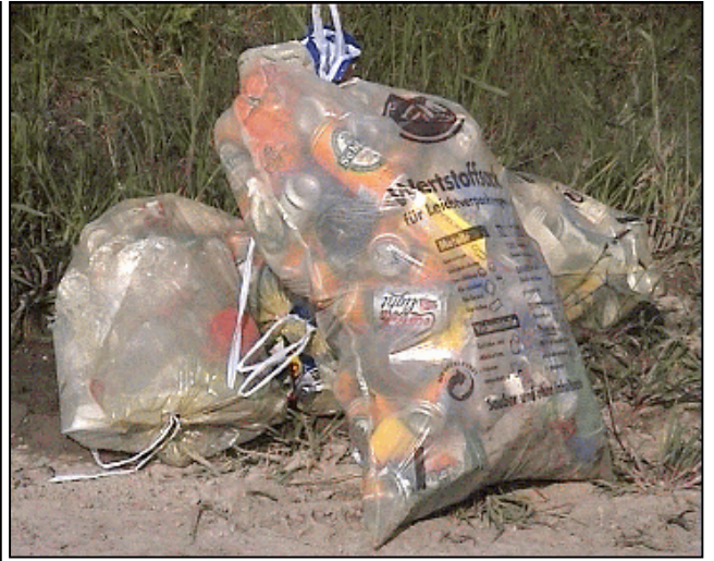
Die Reste eines Grillfestes so ordentlich sind nicht alle!