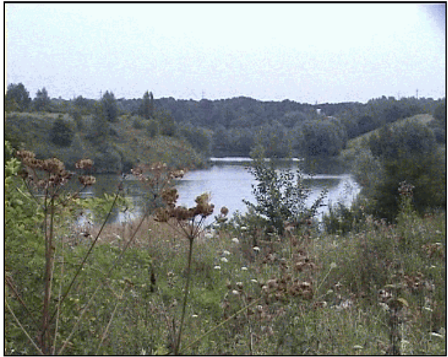
Blick nach Norden