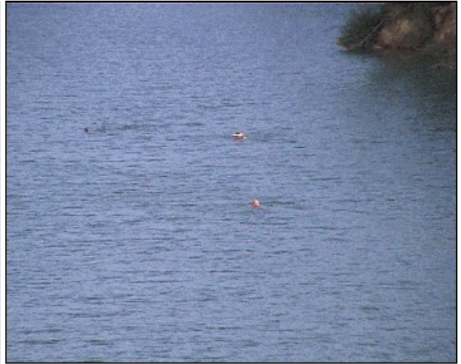
Das Westufer – eigentlich für den Naturschutz reserviert Die Folgen eines ungeordneten Badebetriebs – schon in der ersten Saison