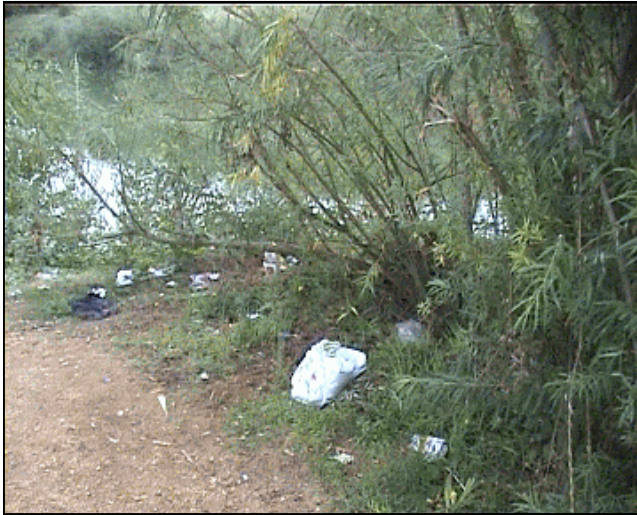
Am Ostufer, dem Hauptzugang